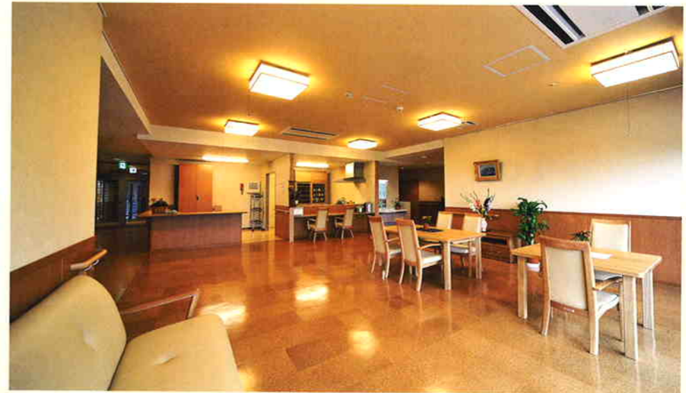
■リビングルーム…家庭的雰囲気のあるキッチン付きリビングです。

明るく家庭的な雰囲気の中で、おひとりおひとりの個性や生活リズムを大切にしながら、ケアをいたします。 気兼ねなくお部屋でのんびり過ごしたり、 キッチンでお料理を楽しんだり、リビングでみなさんとおしゃべりしたり…。 我が家にいるような気持ちで毎日を送っていただけます。