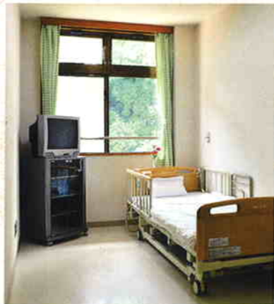
■ショートステイ居室

ご家族が冠婚葬祭や旅行、病気、介護疲れの時、 またご本人の気分転換、 その他の理由で介護できないとき、 施設に短期間入所していただき、 ご家族に代わって日常生活のお世話をいたします。 ご自宅までの送迎もお受けいたします。 ご利用者に不安をあたえないよう、 100%笑顔のスタッフがお待ちしております。