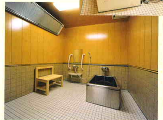
■個浴…いつでも入れる暖房装置つき浴室です。 バスタブは2タイプあります。