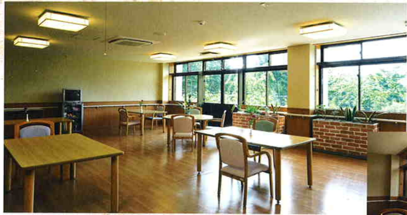
■ホール…家庭的な雰囲気できつらげます。

介護を必要とするお年寄りに入居いただき、長期間にわたってご利用いただくサービスです。 お食事や入浴、排泄など、専門のスタッフが心を込めて日常生活のケアをいたします。 また、楽しく生きがいのある毎日を送っていただけるよう、 健康管理やリハビリ、レクリエーションや季節の行事なども行っています。