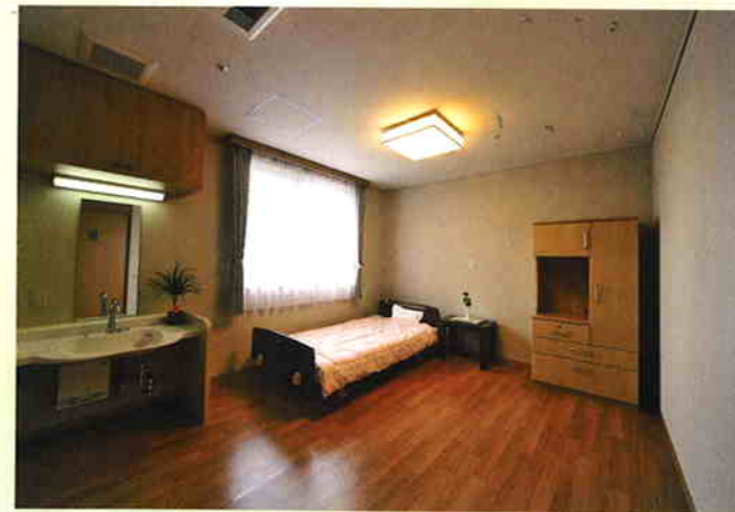
■居室…プライバシーを守る個室です。 お部屋によって違う壁の色や窓の配置が個性を演出します。