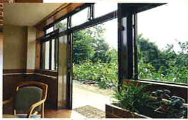
■畑…四季折々の野菜を育てています。