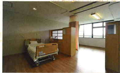
■居室…見晴らしのよいお部屋で ゆったりお過ごしいただけます。