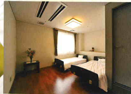
■ゲストルーム…ご家族が泊まれるお部屋です。