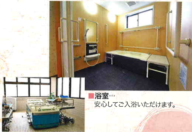
■浴室… 安心してご入浴いただけます。