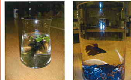
ほおずき・ユニット