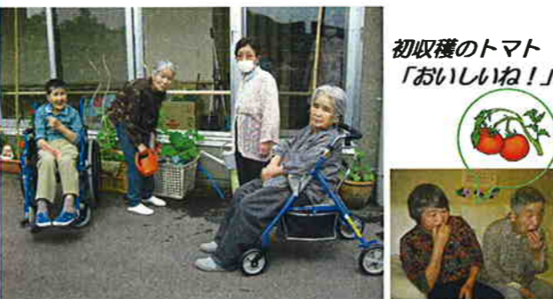
初収穫のトマト「おいしいね！」